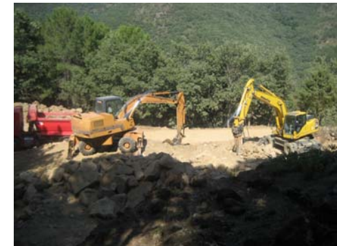
Máquinas trabajando en la zona donde se construirá el depósito de abastecimiento de agua para la urbanización.

La urbanización lindará con el Parque Regional de Gredos. Es más, se mete allí para conseguir el agua del arroyo de Castañarejo que es zona ZEPA, está incluido en la Red Natura 2000 y LIC. Este arroyo representa el ecosistema mejor conservado de bosque de galería de toda la zona, con una flora y fauna únicas . La extracción de agua de este arroyo será su muerte y la de todo un ecosistema asociado a él.