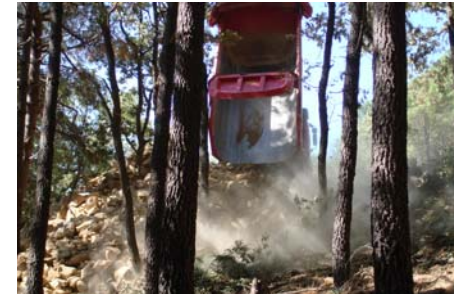
Camión arrojando escombros